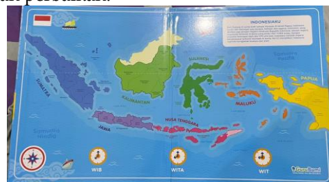
Gambar 3. Peta magnetik

Pada tahap Development mencakup pembuatan media konkret berupa papan magnetik, pin magnetik, dan buku panduan yang membahas tentang Indonesiaku Kaya Hayatinya. Selanjutnya divalidasi oleh ahli materi dan ahli media untuk memperoleh masukan perbaikan.