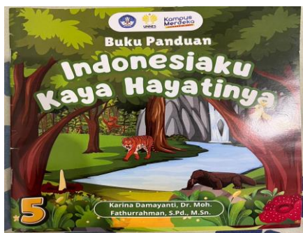
Gambar 4. Produk media akhir

Hasil validasi ahli menunjukkan bahwa media pembelajaran peta magnetik berbasis Problem Based Learning berada pada kategori sangat layak. Validator ahli materi dan ahli media secara keseluruhan menyatakan bahwa media yang dikembangkan