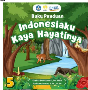
Gambar 1. Design buku panduan

Pada tahap Design , peneliti mulai merancang desain produk dengan mengacu pada hasil analisis kebutuhan yang telah dilakukan sebelumnya. Pada tahap ini meliputi perancangan media peta magnetik dan penyusunan alur pembelajaran berbasis Problem Based Learning (PBL) dengan memperhatikan aspek visual, keamanan, serta kemudahan penggunaan bagi peserta didik sekolah dasar. Proses perancangan media dilakukan menggunakan aplikasi Canva sebagai alat desain visual.