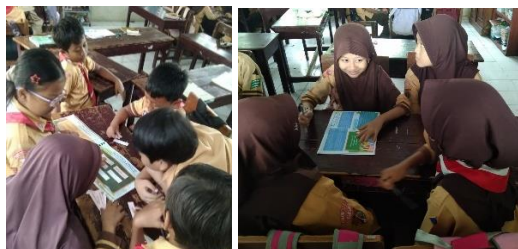
Gambar 5. Penggunaan media scrapbook art and craft oleh siswa

Gambar 5 tersebut menunjukkan penggunaan media scrapbook art and craft oleh siswa. Terlihat siswa menggunakan media scrapbook art and craft secara berkelompok yang di dalamnya terdapat aktivitas membaca, menulis, dan menempel mengenai materi kalimat efektif.