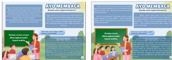
Gambar 3. Revisi penulisan materi