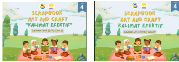
Gambar 2. Perbandingan layout judul sebelum direvisi dan setelah direvisi

Revisi aspek penulisan judul, 2) revisi aspek penulisan materi, dan 3) Revisi aspek penyajian materi.