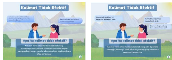
Gambar 4. Revisi penyajian materi