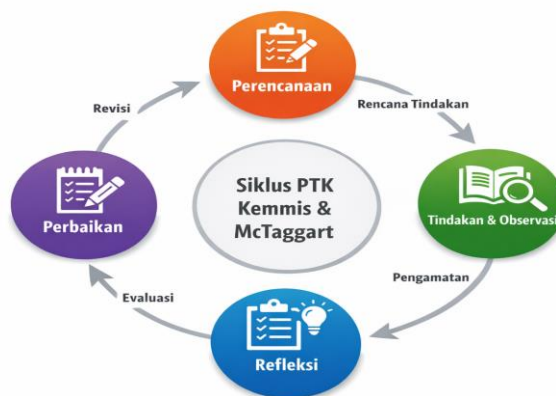
Gambar 1. Bagan siklus PTK (II Siklus)

pada model PTK Kemmis dan McTaggart. Menurut Kemmis dan McTaggart (1990), penelitian tindakan kelas merupakan penelitian yang dilakukan secara reflektif oleh praktisi pendidikan di kelasnya sendiri untuk memperbaiki kualitas proses pembelajaran. Model PTK Kemmis dan McTaggart terdiri atas empat tahapan, yaitu perencanaan ( planning ), pelaksanaan tindakan ( acting ), observasi ( observing ), dan refleksi ( reflecting ). Dalam model ini, kegiatan pelaksanaan tindakan dan observasi dilakukan secara bersamaan karena proses tindakan dan pengamatan terjadi dalam waktu yang sama (Arikunto, Suhardjono, & Supardi, 2019).