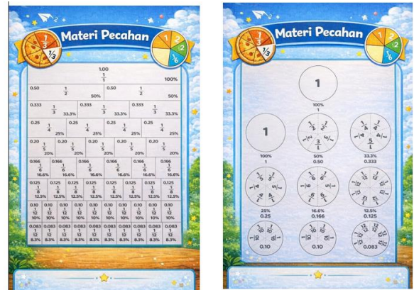
Gambar 2. Bagian Isi

karakteristik siswa sekolah dasar. Cover menampilkan ilustrasi anak-anak yang sedang belajar pecahan dengan ekspresi ceria, disertai gambar-gambar pendukung seperti kepingan pecahan, simbol matematika, dan alat bantu belajar yang merepresentasikan konsep pecahan senilai.