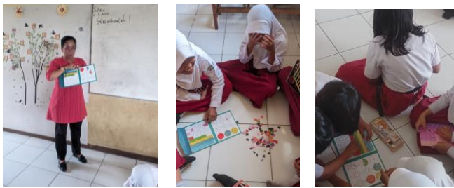
Gambar 2. Siswa menggunakan media puzzle berbasis problem based learning pada uji coba skala besar

Pada tahap uji coba skala besar yang dilaksanakan di kelas IV B SD N Tambakaji 03, media diimplementasikan secara optimal dalam proses pembelajaran. Sebelum kegiatan pembelajaran dimulai, siswa terlebih dahulu mengerjakan soal pretest untuk mengetahui kemampuan awal mereka. Selanjutnya, pembelajaran dilaksanakan dengan memanfaatkan media Puzzle Pecahan berbasis model pembelajaran Problem Based Learning (PBL). Di akhir kegiatan, siswa mengerjakan posttest serta mengisi angket tanggapan, begitu pula guru memberikan respons terhadap penggunaan media tersebut.