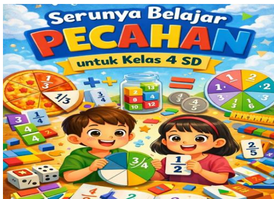
Gambar 1. Bagian Cover

Media puzzle pecahan merupakan media pembelajaran konkret yang dirancang untuk membantu siswa kelas IV sekolah dasar dalam memahami materi pecahan, khususnya pecahan senilai. Media ini dapat dilihat dan disentuh secara langsung oleh siswa sehingga memungkinkan terjadinya pembelajaran yang bersifat manipulatif ( hands-on learning ). Pengembangan media ini dikombinasikan dengan model pembelajaran Problem Based Learning (PBL), sehingga dalam penggunaannya siswa tidak hanya menyusun puzzle, tetapi juga terlibat dalam proses pemecahan masalah yang berkaitan dengan konsep pecahan. Berikut merupakan design dari Puzzle Pecahan. Media puzzle ini dilengkapi dengan cover yang dirancang menggunakan warna cerah dan ilustrasi yang menarik sesuai dengan karakteristik siswa sekolah dasar. Tampilan visual yang ramah anak bertujuan untuk meningkatkan minat dan motivasi belajar siswa sejak awal penggunaan media. Pada bagian belakang buku puzzle terdapat panduan penggunaan media yang disusun secara sistematis dengan bahasa yang sederhana dan mudah dipahami, sehingga siswa dapat menggunakan media secara mandiri maupun berkelompok. Bagian inti media terdiri atas kepingan-kepingan puzzle berbentuk bidang geometri dengan warna yang berbeda, di mana setiap kepingan merepresentasikan nilai pecahan tertentu. Berikut merupakan design Puzzle Pecahan.