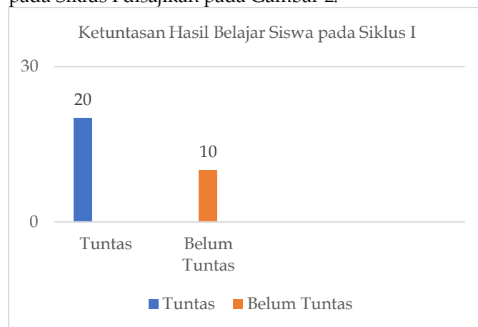
Gambar 2. Diagram Hasil Belajar Kognitif Siswa pada Siklus I.

Observasi pada Siklus I menunjukkan bahwa kemampuan membaca puisi siswa mulai mengalami peningkatan seiring dengan berlangsungnya proses pembelajaran. Beberapa siswa yang sebelumnya kurang percaya diri mulai berani membacakan puisi di depan kelas, meskipun masih terdapat sebagian siswa yang belum menunjukkan kepercayaan diri yang optimal. Berdasarkan hasil tes yang dilakukan, dari 30 siswa terdapat 20 siswa (66,66%) yang telah mencapai nilai minimal 75, sedangkan 10 siswa (33,34%) masih belum mencapai nilai minimal tersebut. Data hasil belajar siswa pada Siklus I disajikan pada Gambar 2.