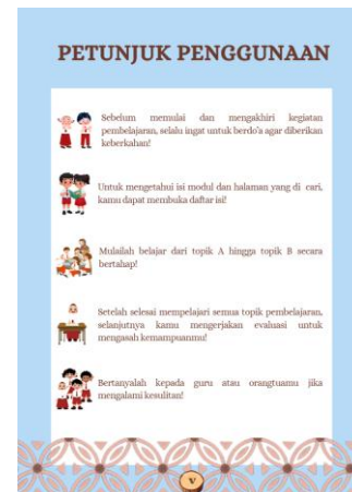
Gambar 3. Petunjuk Penggunaan