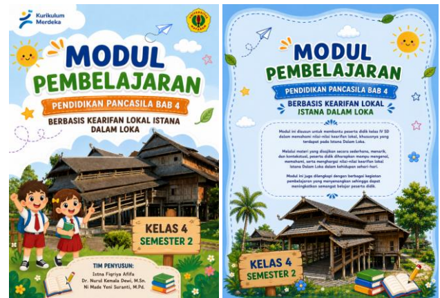
Gambar 2. Cover depan dan belakang modul pembelajaran

Pada tahap development (pengembangan), modul pembelajaran berbasis kearifan lokal Istana Dalam Loka yang telah dirancang kemudian dikembangkan menjadi produk utuh yang siap digunakan. Pengembangan adalah tahapan realisasi atau perwujudan dari rancangan produk yang telah dilakukan di tahapan sebelumnya (Sumiati et al. , 2023). Tahap pengembangan produk modul pembelajaran ini terdiri dari beberapa langkah yang terdiri dari pembuatan produk modul pembelajaran, pencetakan produk dan proses validasi.