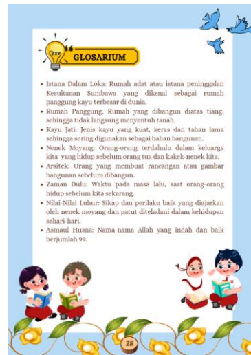
Gambar 9. Glosarium