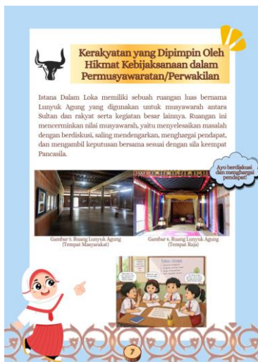
Gambar 5. Materi Topik A (Makna Sila-Sila Pancasila di Lingkungan Masyarakat Suku Samawa Berbasis Kearifan Lokal Istana Dalam Loka)