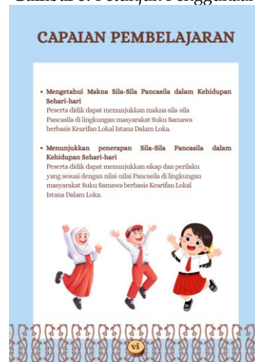
Gambar 4. Capaian Pembelajaran