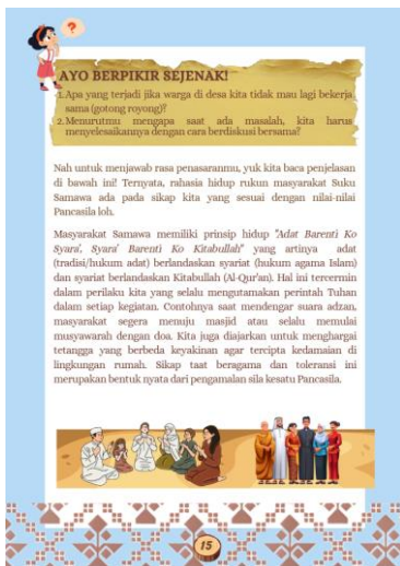
Gambar 6. Materi Topik B (Sikap dan Perilaku yang Mencerminkan Pengamalan Pancasila dalam Kehidupan Bermasyarakat Suku Samawa)