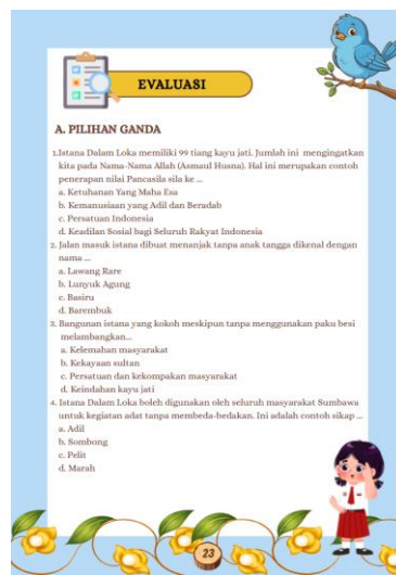
Gambar 8. Evaluasi