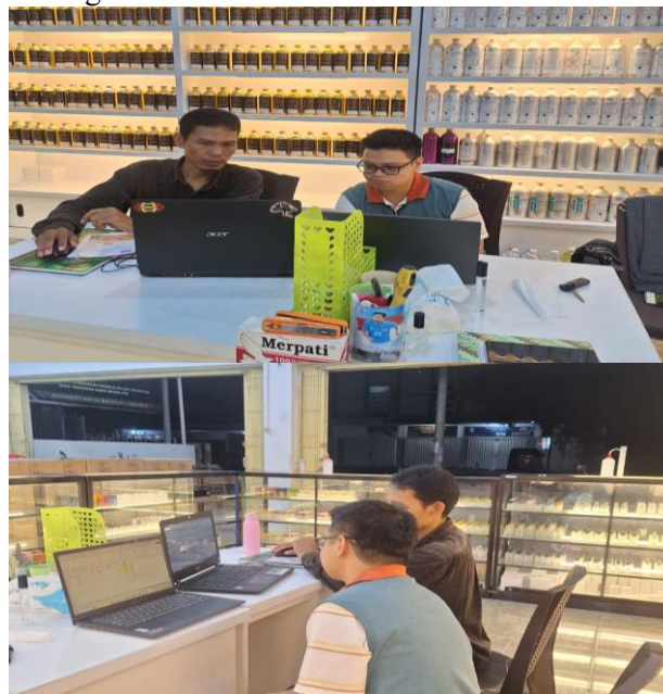
Gambar 1. Pendampingan Pembukuan Digital Menggunakan Excel Akuntansi dan Google Sheets

Berikut kegiatan pendampingan yang dilakukan bersama pemilik menggunakan Excel Akuntansi dan Google Sheets pada pencatatan keuangan Toko Parfum “X”.