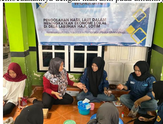
Gambar 3. Pelatihan Pengolahan Ikan Bage’

garam dan buah asam, serta mengeringkannya. Pengeringan dapat dilakukan dengan menggunakan alat pengering atau dilakukan secara tradisional yaitu memanfaatkan sinar matahari. Pada Ikan Bage’, proses penggaraman, pengasaman, dan pengeringan tidak hanya sekedar meningkatkan daya tahan ikan, namun juga mampu memberikan cita rasa yang unik. Penggunaan buah asam pada Ikan Bage’ menjadi ciri khas dari produk ini yang membedakannya dengan ikan asin pada umumnya.