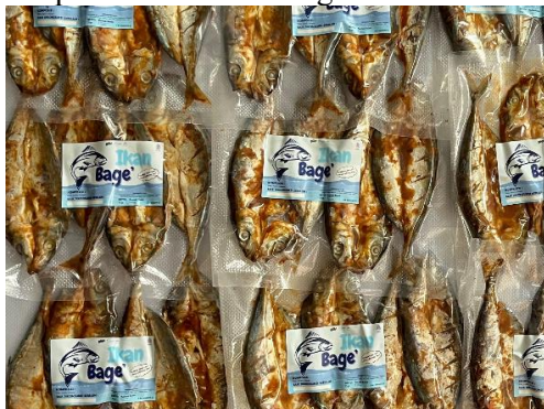
Gambar 5. Produk Ikan Bage’

Pelatihan ini juga mencakup kegiatan pelabelan. Peserta diajarkan tentang informasi-informasi penting yang harus tercantum dalam label. Label dicetak dengan mencantumkan informasi-informasi penting seperti nama produk, komposisi, berat bersih ( netto ), tanggal pembuatan, dan lain-lain. Proses penempelan label dilakukan sebelum produk dikemas dengan vacuum sealer .