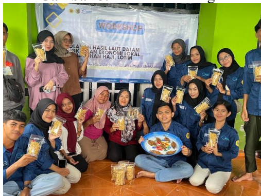
Gambar 6. Pelatihan Pengolahan dan Pengemasan Ikan Bage’

Selama proses pelatihan, para peserta ikut serta dalam mempraktikkan cara mengolah dan mengemas Ikan Bage’. Tahapan ini dirancang agar