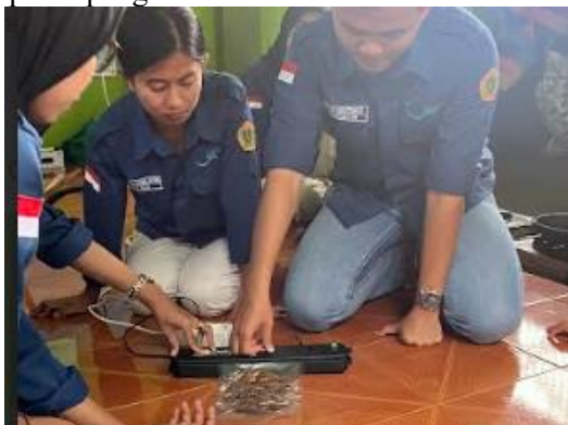
Gambar 4. Pelatihan Pengemasan Menggunakan Vacuum Sealer

dengan menekan tombol “ seal only ” untuk menjaga kerapatan pengemasan.