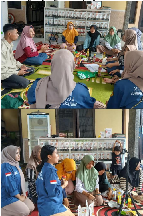
Gambar 8. Studi Banding

Kemitraan merupakan suatu pola kerjasama yang saling menguntungkan antara dua pihak atau lebih untuk mencapai tujuan bersama (Anwar, 2020). Menjalinkan kemitraan merupakan salah satu strategi pemasaran UMKM untuk dapat berkembang secara berkelanjutan. Pada studi banding ini, UMKM yang dikunjungi berbagi pengalamannya dalam upaya menjalin kemitraan dengan instansi pemerintah maupun toko-toko besar serta tantangan-tantangan yang dihadapinya.