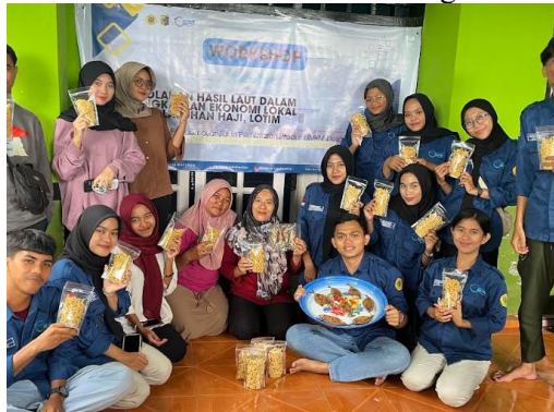
Gambar 6. Pelatihan Pengolahan dan Pengemasan Ikan Bage'

Selama proses pelatihan, para peserta ikut serta dalam mempraktikkan cara mengolah dan mengemas Ikan Bage'. Tahapan ini dirancang agar peserta tidak hanya memahami proses pengolahannya namun juga memiliki keterampilan yang dapat diterapkan secara langsung dalam kegiatan produksi. Berdasarkan hasil pelaksanaan pelatihan, terlihat adanya peningkatan dalam wawasan dan keterampilan peserta dalam mengolah dan mengemas produk olahan Ikan Bage' dengan menggunakan alat pengemas modern yaitu vacuum sealer .