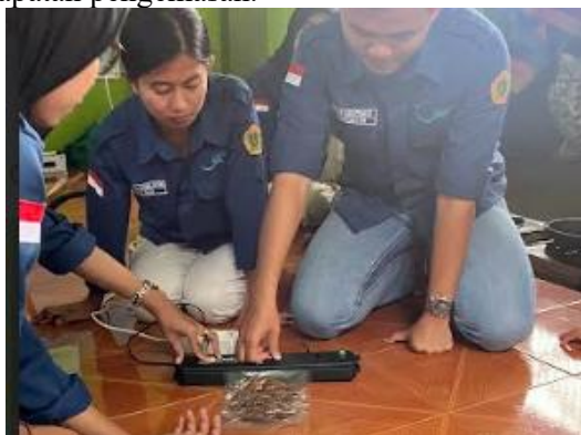
Gambar 4. Pelatihan Pengemasan Menggunakan Vacuum Sealer

diikuti dengan proses penyegelitan otomatis. Setelah proses ini selesai, tim melakukan penyegelitan ganda dengan menekan tombol “ seal only ” untuk menjaga kerapatan pengemasan.