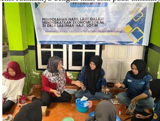
Gambar 3. Pelatihan Pengolahan Ikan Bage’

pembuatan Ikan Bage’ yang dimulai dengan membersihkan dan membelah ikan, melumuri garam dan buah asam, serta mengeringkannya. Pengeringan dapat dilakukan dengan menggunakan alat pengering atau dilakukan secara tradisional yaitu memanfaatkan sinar matahari. Pada Ikan Bage’, proses penggaraman, pengasaman, dan pengeringan tidak hanya sekedar meningkatkan daya tahan ikan, namun juga mampu memberikan cita rasa yang unik. Penggunaan buah asam pada Ikan Bage’ menjadi ciri khas dari produk ini yang membedakannya dengan ikan asin pada umumnya.