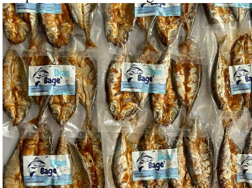
Gambar 5. Produk Ikan Bage'

Pelatihan ini juga mencakup kegiatan pelabelan. Peserta diajarkan tentang informasi-informasi penting yang harus tercantum dalam label. Label dicetak dengan mencantumkan informasi-informasi penting seperti nama produk, komposisi, berat bersih ( netto ), tanggal pembuatan, dan lain-lain. Proses penempelan label dilakukan sebelum produk dikemas dengan vacuum sealer .