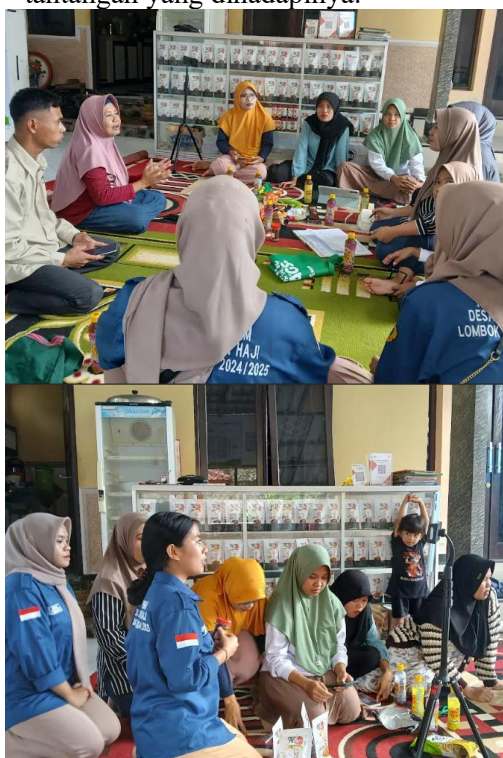
Gambar 8. Studi Banding Pengenalan Strategi Pemasaran

Kemitraan merupakan suatu pola kerjasama yang saling menguntungkan antara dua pihak atau lebih untuk mencapai tujuan bersama (Anwar, 2020). Menjalin kemitraan merupakan salah satu strategi pemasaran UMKM untuk dapat berkembang secara berkelanjutan. Pada studi banding ini, UMKM yang dikunjungi berbagi pengalamannya dalam upaya menjalin kemitraan dengan instansi pemerintah maupun toko-toko besar serta tantangan-tantangan yang dihadapinya.