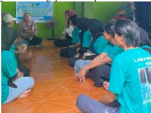
Gambar 2. Pelaksanaan Focus group discussion

diskusi dan menyusun rencana kegiatan yang berfokus pada pemberdayaan sumber daya melalui pelatihan dalam pengolahan dan pengemasan serta pengenalan strategi pemasaran produk olahan ikan.