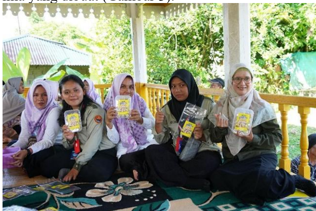
Gambar 3. Praktek Pacakaging Produk Masyarakat Desa Koto Benai

Kegiatan Pemberdayaan ini juga memberikan pelatihan bagaimana cara mengemas produk olahan masyarakatl, memberi label atau stiker serta kemasan apa yang terbaik untuk setiap jenis produk yang dihasilkan sehingga dapat memberikan nilai jual yang tinggi. Masyarakat langsung mempraktekkan untuk mengemas produk bakso ikan nila yang dibuat (Gambar 3).