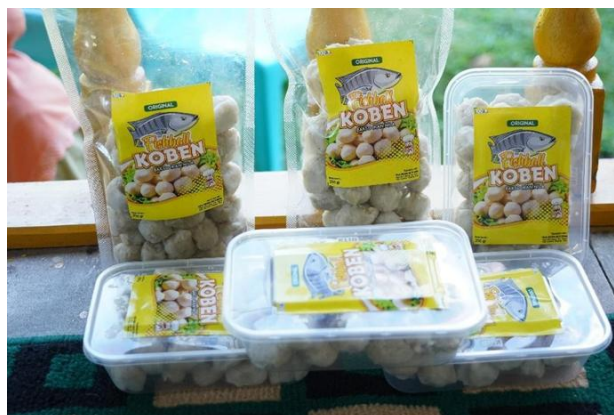
Gambar 4. Hasil Kemasan Produk Masyarakat Desa Koto Benai

menghasilkan kemasan-kemasan dari olahan produk lokal masyarakat Desa Koto Benai (Gambar 4).