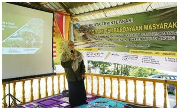
Gambar 1. Kegiatan Pengabdian Kepada Masyarakat

Agustus 2023 dan akan diakhir dengan kegiatan monitoring dan evaluasi diakhir program.