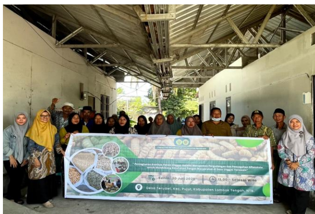
Gambar 2. Sosialisasi dan pelatihan manajemen dan pencegahan kontaminasi aflatoksin