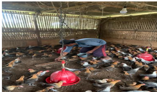
Gambar 3. Pemberian maggot dalam pakan ayam.