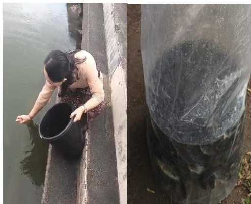
Gambar 3. Melakukan Pelepasan Ikan

Dalam konteks odalan pura, Purnama Jyesta memiliki makna filosofis yang dalam, yaitu sebagai momentum penyatuan kembali antara manusia, alam, dan Ida Sang Hyang Widhi Wasa di tempat suci (Pura Mayura). Odalan pada hari ini bukan hanya perayaan, tetapi juga proses penyucian secara lahir dan batin.