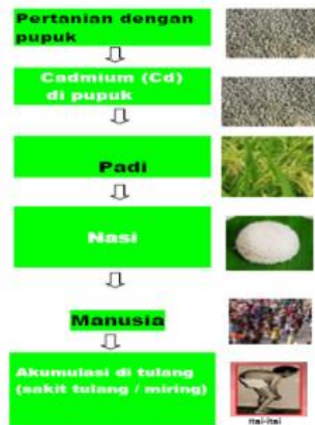
Gambar 2. Model Akumulasi logam Cd

Unsur logam berat Cd yang memasuki lingkungan badan air, seperti danau, sungai, dam atau bendungan, dan juga teluk dengan mudah dapat mengalami akumulasi mengikuti trofik dari rantai makanan. Jika Cd ada dalam organ tubuh tanaman