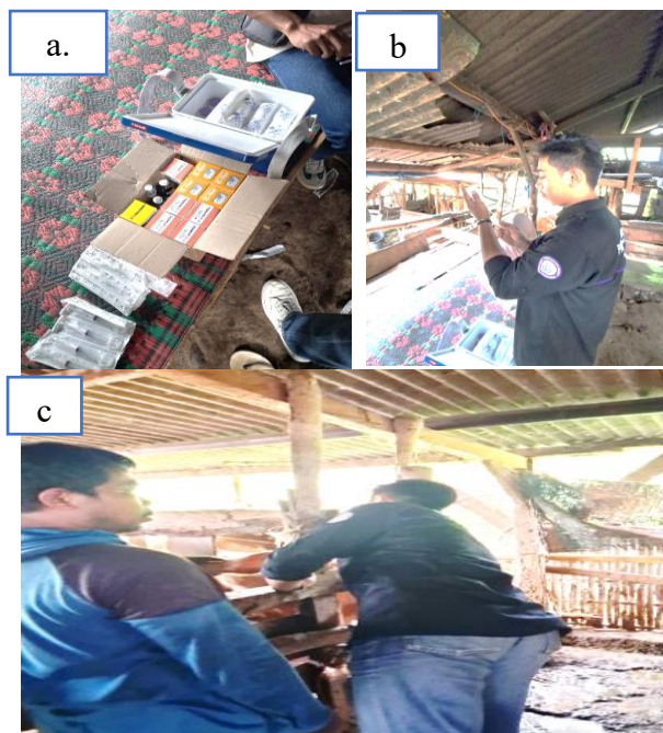
Gambar 2. a. alat dan bahan; b. persiapan vaksinasi; c. pelaksanaan vaksinasi.

Pelaksanaan kegiatan berjalan dengan lancar, kegiatan dilakukan di 2 desa, masing-masing desa terdapat 2 lokasi. Jadi total lokasi tempat melakukan vaksinasi PMK sebanyak 4 lokasi. Jumlah petugas yang terlibat di UPTD Suela 2 orang dokter hewan dan 6 orang paramedik. Sedangkan petugas di UPTD Wanasaba terdiri dari 3 orang dokter hewan dan 8 orang paramedik. Petugas-petugas tersebut dibantu oleh 4 orang mahasiswa PKL program studi D-3 Agribisnis Peternakan Fakultas Peternakan Universitas Mataram. Kegiatan dilaksanakan selama 2 hari masing-masing 5-jam per hari.