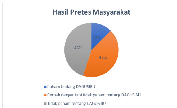
Gambar 1. Hasil pretes masyarakat tentang DAGUSIBU

Menurut hasil kuisioner sebelum diberikannya edukasi tentang materi DAGUSIBU, banyak masyarakat yang tidak mengetahui tentang DAGUSIBU sebanyak 87.5% dan 12.5 % paham tentang DAGUSIBU. Hasil lebih lengkap ditunjukkan oleh gambar 1 dibawah ini.