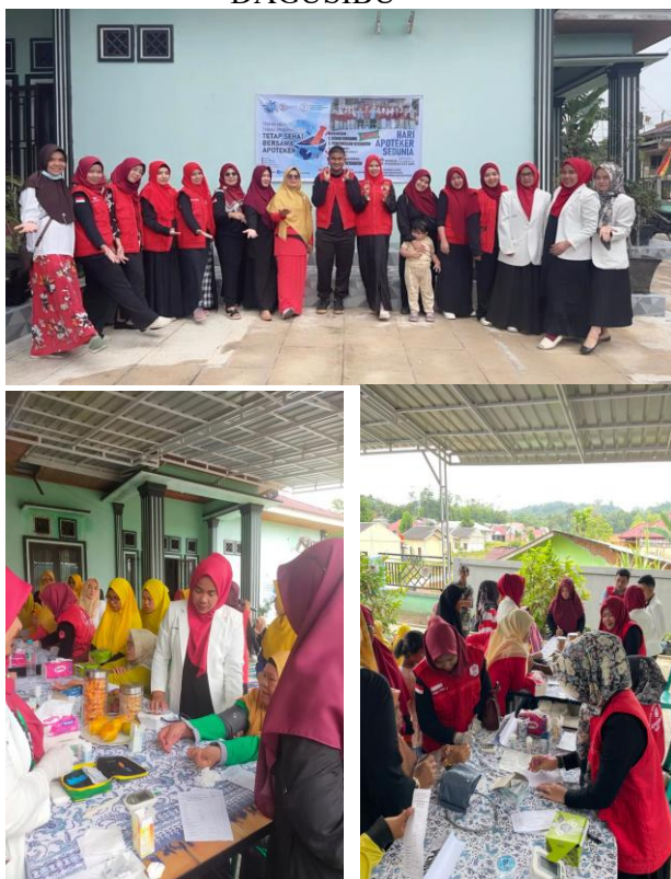
Gambar 3. Pelaksanaan World Pharmacist Day