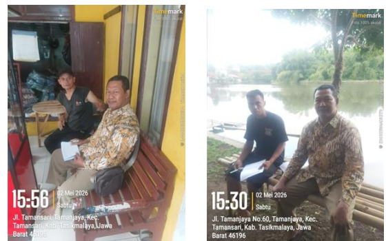
Gambar 3. osialisasi Masyarakat Menjelaskan Kewaspadaan Ketinggian Muka Air Banjir