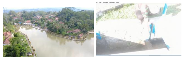
Gambar 3. Sosialisasi Masyarakat Menjelaskan Kewaspadaan Ketinggian Muka Air Banjir

Sehingga pada elevasi ini yang disosialisasikan pada masyarakat disekitar Situ Wangi Agar Waspada, adapun dokumentasi sosialisasi ketinggian muka air banjir pada masyarakat dapat dilihat pada Gambar 3.