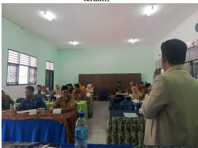
Gambar 8. Penjelasan mengenai pendekatan STEAM dalam pembelajaran fisika