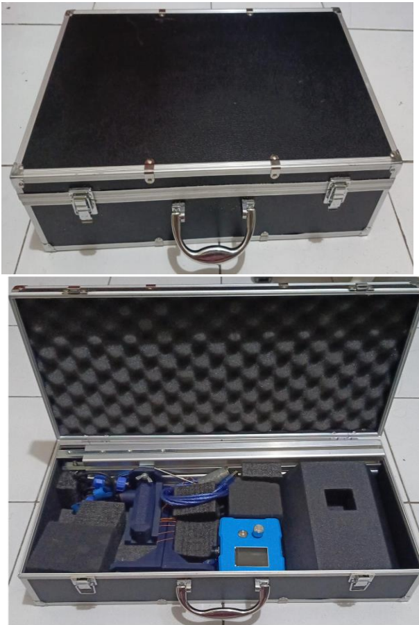
Gambar 2. KIT Peraga

KIT peraga bandul matematis berbasis sensor yang telah teruji fungsionalitasnya;