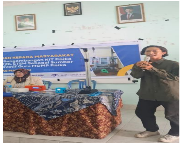
Gambar 4. Penjelasan penggunaan alat KIT oleh tim pengabdian