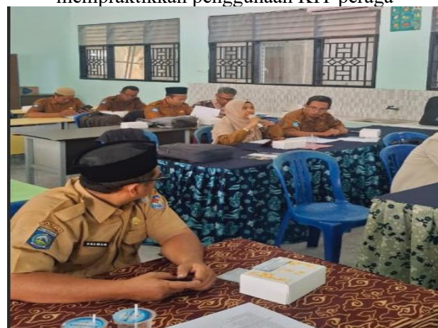
Gambar 6. Pertanyaan peserta terkait dengan teknik kalibrasi dari alat