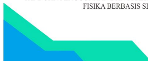
Gambar 1. Buku petunjuk praktikum

Buku petunjuk praktikum bandul matematis berbasis sensor yang dapat digunakan sebagai panduan guru dalam melaksanakan praktikum di sekolah