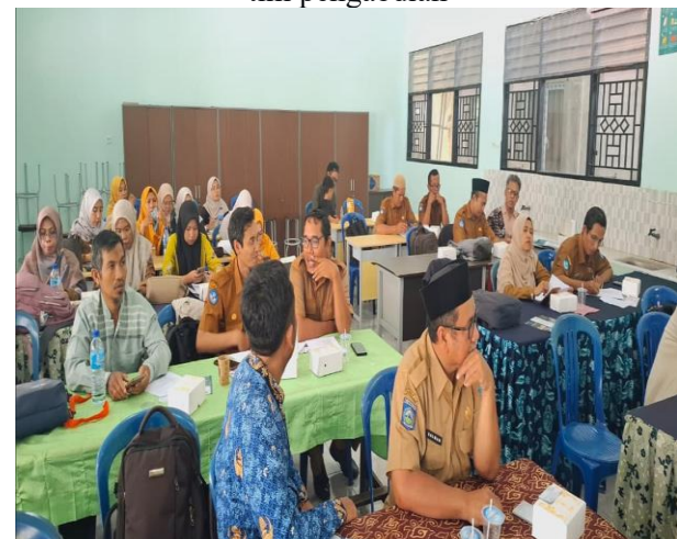
Gambar 5. Suasana peserta pelatihan saat mempraktikkan penggunaan KIT peraga