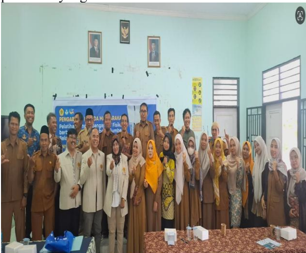
Gambar 3. Kegiatan Pelatihan Bersama Peserta MGMP Fisika Kabupaten Lombok Timur

Berikut adalah dokumentasi kegiatan pelatihan yang dilaksanakan: