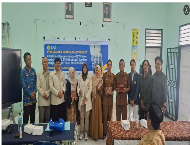
Gambar 7. Pembagian doorprize bagi peserta teraktif