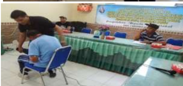
Gambar 4 Kegiatan II: Pelatihan Gerak Aktif Sebagai Upaya Preventif HNP

Pada sesi ketiga, dilakukan pelatihan gerak aktif sehingga dalam melakukan kegiatan bertani, para petani dapat melakukan pencegahan preventif terhadap gejala herniated nucleus pulposus (HNP) seperti yang yang terlihat pada Gambar 4. Pada tahap akhir penyuluhan terdapat beberapa warga yang bertanya terkait masalah sakit pinggang kepada para petugas kesehatan, lalu petugas kesehatan memberikan penjelasan yang dapat dilakukan melalui gerak aktif tersebut.