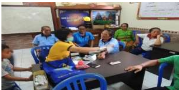
Gambar 3 Kegiatan II: Pemeriksaan Kesehatan Kepada Para Petani di Desa Susut, Kabupaten Bangli

Pada kegiatan kedua ini, tim pengabdian menyampaikan penerapan prinsip keselamatan, kesehatan, kerja (K3), seperti penggunaan topi kerja, penggunaan masker, penggunaan sepatu boots, memperhatikan penggunaan teknologi dan satndar keseamatan dalam kegiatan usaha tani.