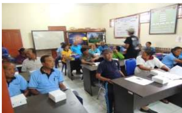
Gambar 2 Kegiatan I : Kelompok tani sebagai peserta pelatihan prinsip kesehatan dan keselamatan kerja (K3)