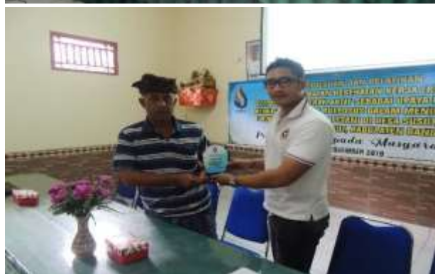
Gambar 1 Kegiatan I: Penyuluhan Prinsip Keselamatan, Kesehatan, Kerja (K3) di Bidang Pertanian