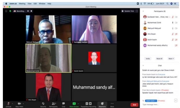
Gambar 5. Kegiatan see oleh guru fisika SMAN 5 Mataram dan tim pengabdian.

Tahap see dilaksanakan pada tanggal 23 Oktober 2020 secara daring melalui zoom meeting . Pada tahap ini, observer (guru dan tim pengabdian) memberikan penilaian dan tanggapan terkait dengan proses pembelajaran yang telah dilakukan oleh guru model. Hasil see dari observer diantaranya adalah secara keseluruhan proses pembelajaran berjalan lancar, semua skenario yang telah direncanakan terlaksana dalam pembelajaran tersebut, tujuan pembelajaran tercapai semua, kegiatan pembelajaran cukup menarik dan sempurna, serta dapat diterapkan pada mata pembelajaran yang lain. Tahap see ditunjukkan pada Gambar 5.