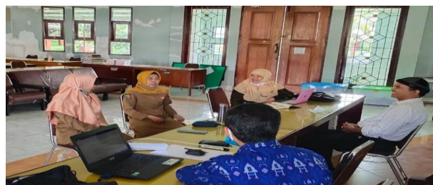
Gambar 2. Kegiatan plan oleh guru fisika SMAN 5 Mataram dan tim pengabdian

Tahap plan dilaksanakan pada tanggal 9 Oktober 2020 secara offline di SMAN 5 Mataram. Tahap ini dihadiri oleh tiga orang guru fisika dan dua orang dosen fisika. Hasil plan ini adalah untuk kegiatan do , materi yang dibahas adalah induksi magnetik pada kelas dua belas IPA yang akan dilaksanakan pada pertemuan berikutnya. Tahap plan ditunjukkan pada Gambar 2.