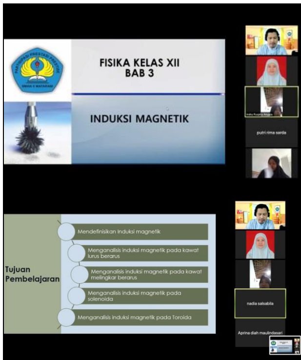
Gambar 3. Kegiatan penyampaian materi induksi magnetik oleh guru model

Tahap do dilaksanakan pada tanggal 23 Oktober 2020 secara daring melalui zoom meeting. Tahap ini dihadiri oleh dua orang guru fisika, lima orang dosen fisika, dan dua puluh lima orang peserta didik kelas dua belas IPA. Pada tahap ini, seorang guru bertugas sebagai guru model, sedangkan guru yang lain dan tim pengabdian mengamati kegiatan pembelajaran yang sedang berlangsung untuk diberikan penilaian saat refleksi. Adapun materi fisika yang disampaikan adalah induksi magnetik (Gambar 3). Pembelajaran dilakukan melalui kegiatan praktikum menggunakan media virtual PhET.