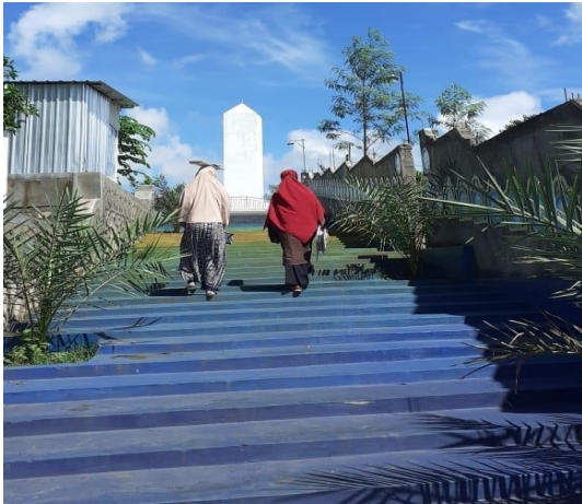
Gambar 2. Observasi lokasi wisata