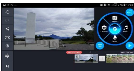
Gambar 5. Pembuatan video promosi dengan aplikasi Kinemaster.