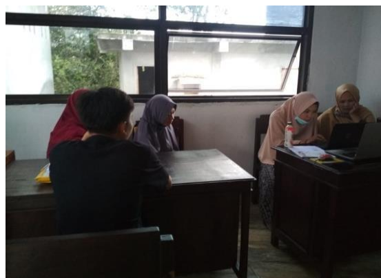
Gambar 3. Pengumpulan informasi terkait taman wisata pada pengelola taman wisata edukasi Jabal Rahmah