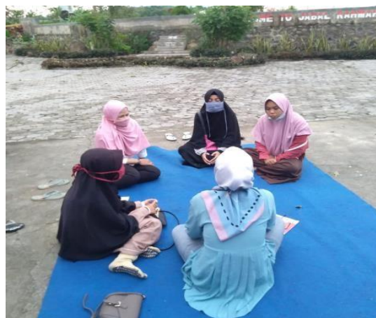
Gambar 1. Wawancara dengan pengelola taman wisata edukasi Jabal Rahmah terkait keunikan tempat wisata

b. Observasi tempat wisata secara langsung dan melihat keunikan yang menjadi daya tarik pengunjung di tempat wisata.