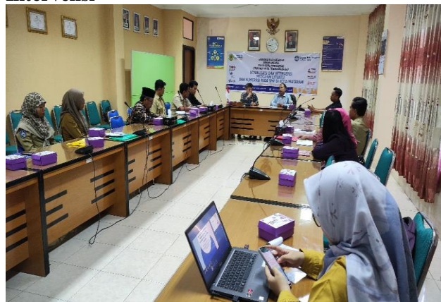
Gambar: Foto Kegiatan sosialisasi dan intervensi Literasi, Numerasi 2023

Kegiatan sosialisasi dan intervensi kepada satuan pendidikan jenjang SMP merupakan upaya meningkatkan kompetensi guru dan pemahaman tentang bagaimana meningkatkan pemahaman siswa dalam literasi dan numerasi.