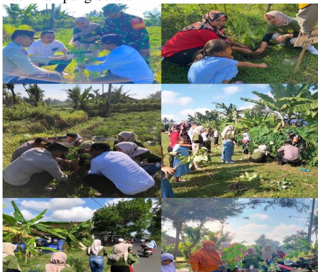
Gambar 6. Pelaksanaan Kegiatan

Setelah pembukaan ,proses selanjutnya yaitu pelaksanaan kegiatan inti penanaman pohon yang berlokasi di Lapangan Paok Pampang sebagai lokasi utama dan sepanjang jalan yang berlokasi di Dusun Paok Pampang Selatan. Kegiatan penanaman ini di ikuti oleh masyarakat dan aparat desa. Kegiatan penanaman di mulai dari lapangan kemudian di lanjutkan di sepanjang jalan di Dusun Paok Pampang Selatan.