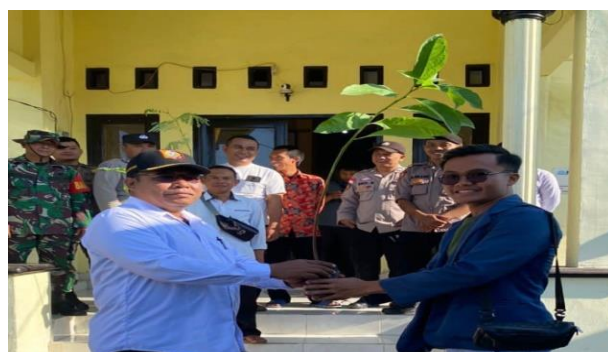
Gambar 4. Penyerahan Bibit Pohon