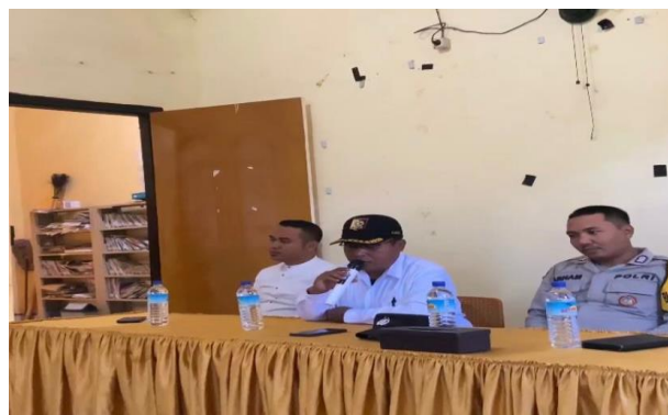
Gambar 3. Sambutan Kepala Desa

merupakan salah satu bagian dari upaya konservasi. Pelaksanaan kegiatan penanaman bibit pohon dilaksanakan pada hari Rabu, 5 Juli 2023 yang di mulai pada pukul 08.00 WITA. Kegiatan ini dimulai dengan adanya pembukaan yang terdiri dari sambutan kepala desa dan laporan ketua kelompok KKN PMD Universitas Mataram yang bertempat di aula Kantor Desa Paok Pampang.