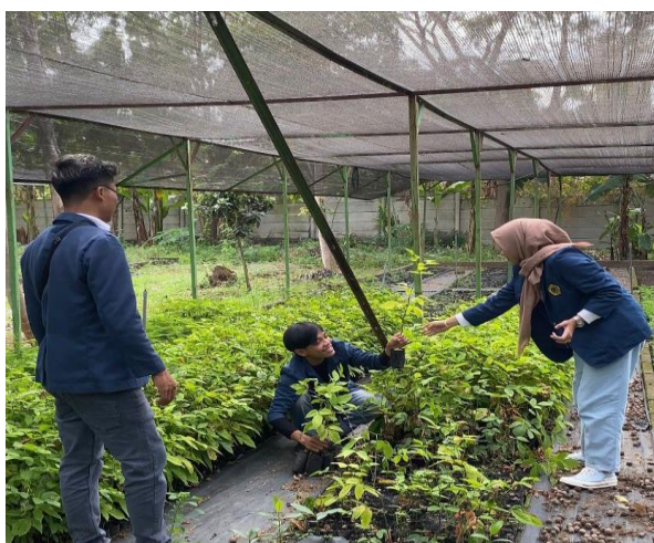
Gambar 2. Pengambilan Bibit Pohon

Langkah selanjutnya yaitu melakukan pengambilan bibit pohon di Persemaian Permanen Balai Pengelolaan Daerah Aliran Sungai (BPDAS) HL Dodokan Moyosari yang berlokasi di Pringgabaya, Lombok Timur.