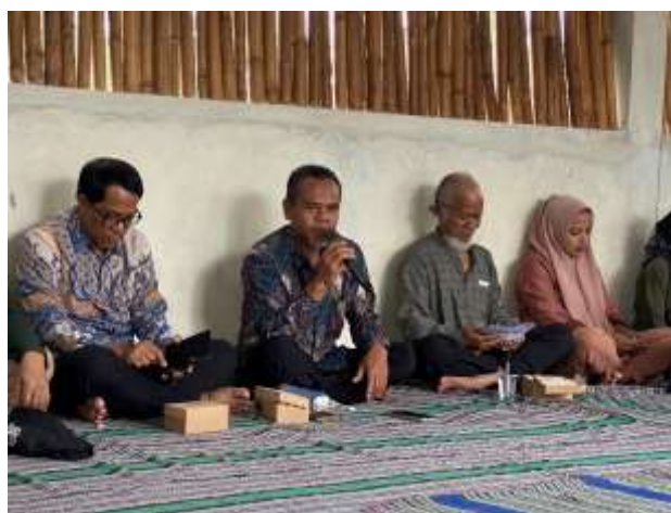
Gambar 6. Sambutan dari Sekertaris Desa Karang Sidemen

dalam dimanfaatkan dengan pengolahan tertentu dapat meningkatkan nilai ekonomi. Limbah kulit kopi dan kakao dapat diolah menjadi pupuk cair, dan dapat dijual sehingga nilai ekonomi dari limbah tersebut bisa lebih tinggi. Selain itu, warga dapat ikut menjaga lingkungan dengan mengolah limbah kopi dan kakao. Dengan pemaparan materi ini menjadikan warga Desa Karang Sidemen mendapatkan ilmu yang lebih luas untuk dapat memanfaatkan limbah tersebut menjadi produk yang memiliki manfaat dan nilai ekonomis yang lebih tinggi. Informasi ini sangat bermanfaat untuk peserta agar mampu mengembangkannya di kemudian hari.