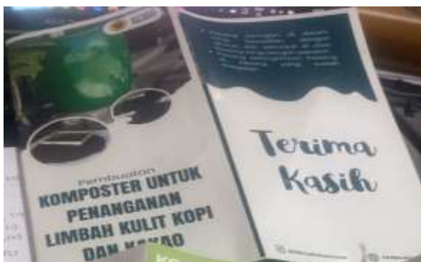
Gambar 4. Leaflet dibagikan kepada peserta kegiatan Pengabdian