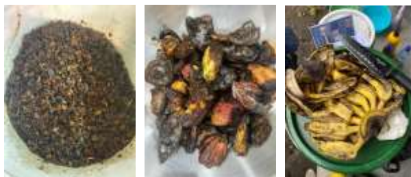
Gambar 5. Limbah kulit kopi, kulit kakao dan kulit pisang di Desa Karang Sidemen

Kegiatan diawali dengan acara pembukaan dengan sambutan yang diberikan oleh Kepala Desa Karang Sidemen yang diwakili oleh Sekertaris Desa, Bapak Suparman Hasim (Gambar 6), yang kemudian disusul dengan penyampaian materi penyuluhan oleh tim pengabdian, praktek pembuatan komposter, diskusi dan tanya jawab, evaluasi dan yang terakhir penutupan. Materi yang disampaikan meliputi pemanfaatan dan pengolahan limbah hasil pertanian di Desa Karang Sidemen, yakni limbah kopi, kakao dan kulit pisang (Gambar 5). Limbah ini menjadi potensi besar di Desa Karang Sidemen karena jumlahnya yang sangat melimpah. Limbah tersebut diolah dengan teknologi pengolahan limbah dengan komposter secara manual dengan alat dan bahan sederhana.