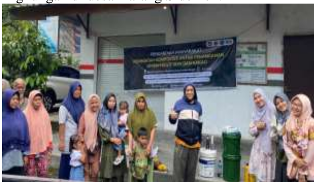
Gambar 9. Foto Bersama Peserta Pembuatan Komposter untuk Penanganan Limbah Kulit Kopi dan Kakao

mampu memahami dan menguasai pembuatan komposter yang dapat dimanfaatkan sebagai pupuk sekaligus membantu peningkatan nilai ekonomis limbah organik yang dapat dimanfaatkan untuk pembuatan komposter. Prospek pemakaian komposter untuk penanganan limbah akan semakin diperlukan dan menjadi peluang komoditi yang dapat dipasarkan. Oleh karenanya standar bahan baku tersebut harus berwawasan lingkungan, dengan memenuhi syarat 4R seperti dituntut oleh masyarakat konsumen internasional yaitu, Reduce of energy, Reuse, Replace dan Recycle . Selanjutnya komposter diharapkan dapat memberikan unsur hara yang dibutuhkan untuk pertumbuhan tanaman dan meningkatkan diversitas mikroorganisme tanah. Para peserta pengabdian merasa sangat terbantu dan juga termotivasi untuk dapat menjaga kelestarian lingkungan di desa Karang Sidemen.