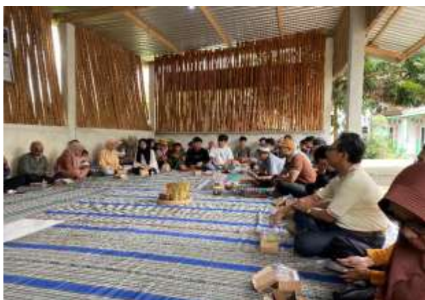
Gambar 7. Warga antusias mendengarkan materi pemaparan

komposter terletak di tempat yang cukup panas atau gunakan metode isolasi tambahan jika diperlukan.