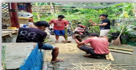
Gambar 17. Pembuatan Bak Sampah

Maka dari itu, dilakukannya small movement yaitu pembuatan bak sampah sebanyak 10 buah dan kegiatan pembersihan pantai bersama Pokdarwis Desa Labuhan Haji yang dilakukan pada minggu terakhir kegiatan KKN dengan tujuan dan harapan meningkatkan kesadaran masyarakat Desa Labuhan Haji untuk pentingnya menjaga kebersihan lingkungan sekitar sehingga kelak Desa Labuhan Haji dapat menjadi desa wisata dengan pengunjung dari lokal, nasional, hingga global.