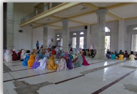
Gambar 7. Mengajar Mengaji di TPQ Eso