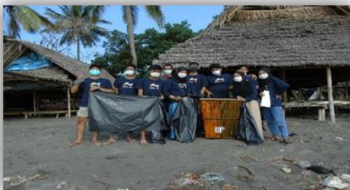
Gambar 23. Pembersihan Pantai Labuhan Haji