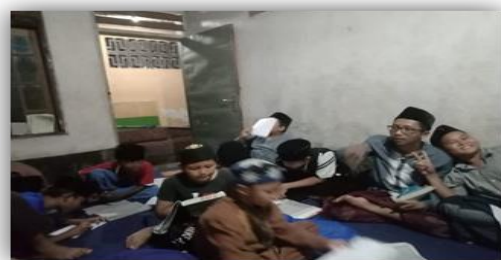
Gambar 5. Mengajar Mengaji di TPQ Ambengan