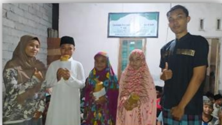
Gambar 9. Penyerahan Hadiah Lomba di TPQ Ambengan