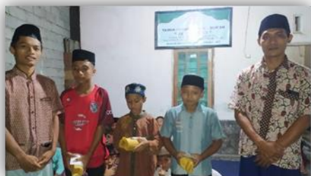
Gambar 8. Penyerahan Hadiah Lomba di TPQ Ambengan

Pada minggu terakhir mengajar mengaji, diadakannya kegiatan lomba praktik sholat, hafalan surat pendek, adzan, dan cerdas cermat tajwid di TPQ Ambengan. Kegiatan ini dilakukan sebagai bentuk luaran dari kegiatan mengajar mengaji serta sebagai bentuk apresiasi kepada anak-anak di TPQ Ambengan yang selalu bersemangat untuk belajar mengaji atau membaca Al-Qur'an.