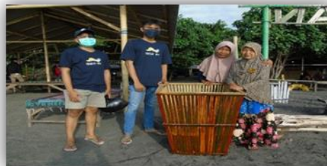
Gambar 20. Penyerahan Bak Sampah di Beberapa Titik di Pinggir Pantai