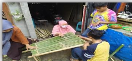
Gambar 18. Pembuatan Bak Sampah