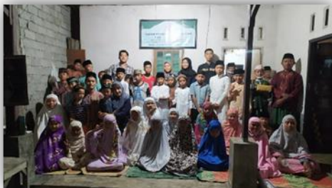
Gambar 10. Foto Bersama di TPQ Ambengan