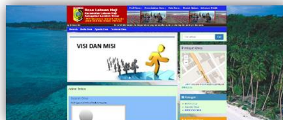
Gambar 2. Tampilan interface Website SID