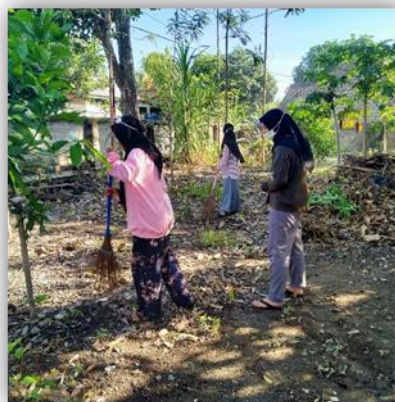
Gambar 11. Pembersihan Masjid Jami Al-Ittihad Desa Labuhan Haji

Mengingat kondisi dengan keadaan pandemi seperti saat ini, sarana umum beserta masyarakat harus selalu dijaga serta menjaga kebersihan dan kesehatannya. Oleh karena itu, dilakukannya kegiatan pembersihan masjid dan pembagian masker setiap hari Jumat di Masjid Jami Al-Ittihad Desa Labuhan Haji.