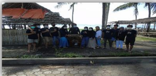
Gambar 22. Penyerahan Bak Sampah di Beberapa Titik di Pinggir Pantai