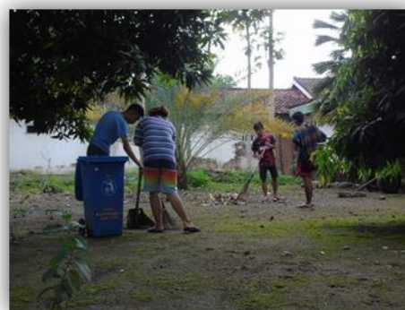
Gambar 12. Pembersihan Masjid Jami Al-Ittihad Desa Labuhan Haji