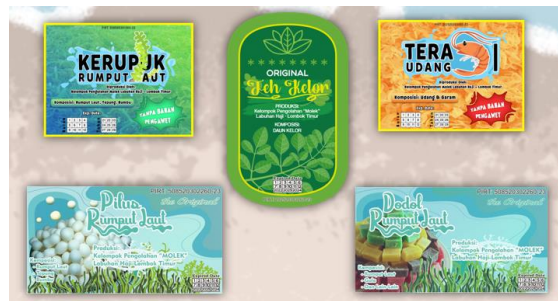
Gambar 15. Rebranding Kemasan dan Label Produk-produk Pangan UMKM Desa Labuhan Haji

produk-produk pangan tersebut dapat menjadi produk unggulan dari Desa Labuhan Haji.