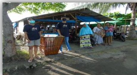
Gambar 21. Penyerahan Bak Sampah di Beberapa Titik di Pinggir Pantai