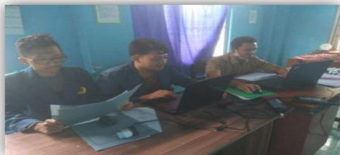
Gambar 3. Pengelolaan data penduduk desa Labuan Haji

labuhan haji yang dimana pengimputan data penduduk ini di lakukan cukup lama karena jumlah penduduk yang banyak serta terganggu oleh server dukcapil yang kadang mengalami beberapa masalah jika pengimputan data terlalu banyak dalam satu hari, setelah pengimputan selesai di lanjutkan dengan melakukan pengecekan data-data yang bercoret marah serta memperbaiki data tersebut sehingga bisa masuk ke server dukcapil setelah itu dilanjutkan dengan pembekapan data untuk pihak desa labuhan haji serta membantu mengupload data ke server dukcapil.