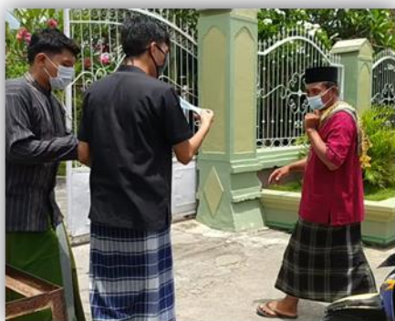
Gambar 14. Pembagian Masker di Masjid Jami Al-Ittihad Desa Labuhan Haji