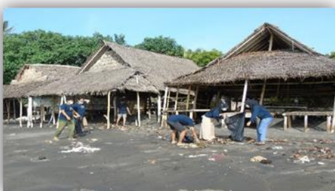
Gambar 24. Pembersihan Pantai Labuhan Haji