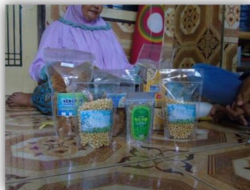
Gambar 16. Rebranding Kemasan dan Label Produk-produk Pangan UMKM Desa Labuhan Haji