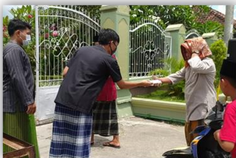
Gambar 13. Pembagian Masker di Masjid Jami Al-Ittihad Desa Labuhan Haji