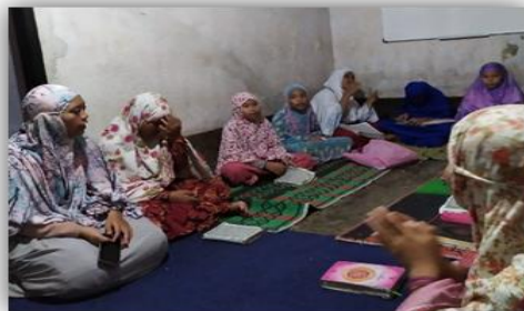
Gambar 4. Mengajar Mengaji di TPQ Ambengan

Dilakukannya kegiatan mengajar mengaji anak-anak pada TPQ di Dusun Ambengan setiap hari Senin, Selasa, Kamis, Sabtu, dan Minggu. Selain itu, dilakukan juga kegiatan mengajar mengaji anak-anak pada TPQ di Dusun Esot setiap hari Rabu dan Jumat. Kegiatan ini dilakukan dengan tujuan agar anak-anak semangat dalam belajar mengaji atau membaca Al-Qur'an sehingga kelak dapat diterapkan dan menjadi keseharian dalam kehidupan.