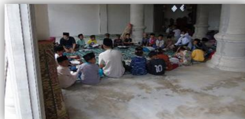
Gambar 6. Mengajar Mengaji di TPQ Esot