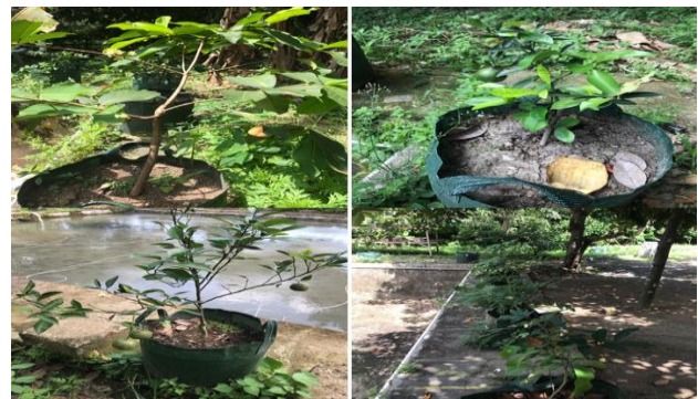
Gambar 3. Tabulampot