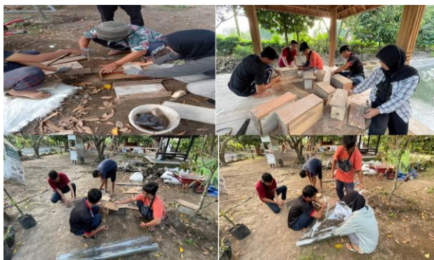
Gambar 8. Proses pembuatan kotak koloni lebah trigona

Selanjutnya dilakukan juga pemecahan koloni lebah trigona untuk meningkatkan produktifitas madu trigona yang dihasilkan oleh kelompok usaha madu trigona di Desa Saribaye. Gambar 9 berikut ini memperlihatkan proses pemecahan koloni lebah trigona ke dalam kotak-kotak koloni yang telah dibuat seperti pada Gambar 8 di atas.