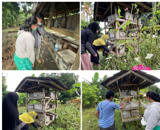
Gambar 10. Kegiatan pembersihan lingkungan tempat tinggal koloni lebah trigona

Budidaya madu trigona membutuhkan perhatian yang ketelatenan peternah untuk memelihara dan menjaga koloni lebah trigona dari predator seperti semut, dan serangga pemangsa lainnya. Masuknya predator ke kotak koloni lebah trigona akan menyebabkan koloni lebah trigona tersebut kabur dari sarangnya. Untuk itu, peternah harus rutin membersihkan lingkungan tempat tinggal lebah trigona. Nampak pada Gambar 10 kegiatan pembersihan lingkungan tempat tinggal koloni lebah trigona