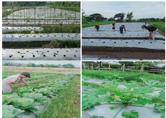
Gambar 7. Budidaya tanaman hortikultura

Selain itu juga dilakukan budidaya tanaman hortikultura yaitu kol, zucchini, dan mentimun. Budidaya berbagai jenis hortikultura ini dilakukan bersama dengan kelompok petani milenial Desa Saribaye. Gambar 7 berikut merupakan proses penyiapan lahan dan proses budidaya tanaman hortikultura tersebut.