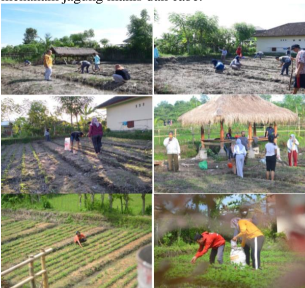
Gambar 5. Kegiatan penyiapan lahan budidaya jagung manis dan cabai

Di lokasi tersebut dilakukan budidaya tanaman tumpang sari sebagai sumber pakan madu trigona, yaitu jagung, cabe, mentimun, tomat, kol, dan lainnya. Selanjutnya, hasil dari tanaman tumpang sari ini bisa dijual secara langsung kepada pembeli, dimana pembeli memetik sendiri sayuran yang mereka ingin. Kegiatan ini dapat menjadi hiburan tersendiri bagi masyarakat, terutama masyarakat yang berasal dari kota. Gambar 5 berikut merupakan proses penyiapan lahan untuk menanam jagung manis dan cabe.