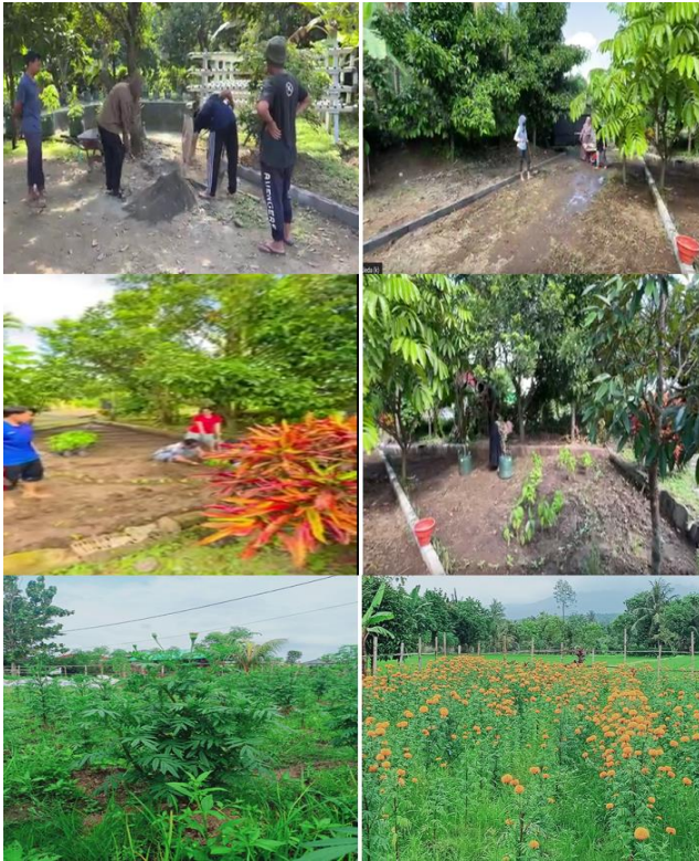
Gambar 1. Budidaya tanaman bunga dan pembuatan taman

Lebih dari itu, tanaman bunga juga memiliki nilai jual yang cukup tinggi, yaitu bunga gumitir, dimana bunga ini digunakan oleh umat hindu, yang banyak terdapat di Lombok, untuk sembayangan. Oleh karena itu, budidaya berbagai jenis tanaman bunga merupakan kegiatan yang potensial untuk meningkatkan sumber pendapatan masyarakat desa Saribaye.