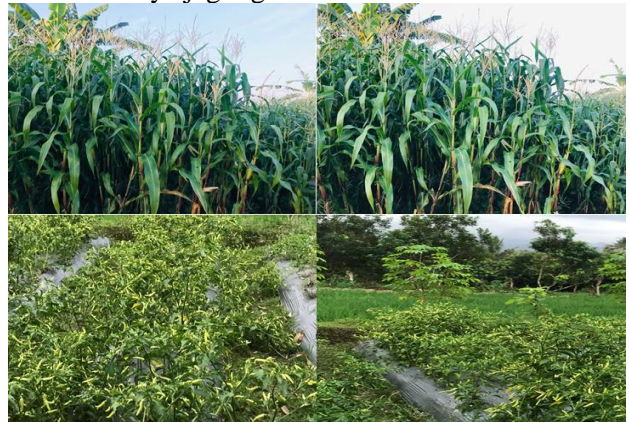
Gambar 6. Hasil budidaya jagung manis dan cabai

Selanjutnya Gambar 6 berikut menunjukkan hasil budidaya jagung manis dan cabai.