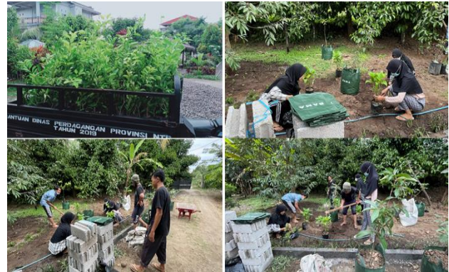
Gambar 2. Budidaya tanaman buah dalam pot (Tabulampot)

300 ribu rupiah per unit. Gambar 2 dan 3 berikut merupakan kegiatan budidaya tabulampot berupa pohon jeruk, kelengkeng, jambu air, dan jambu kristal.