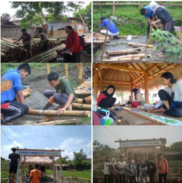
Gambar 4. Kegiatan pengembangan lokasi budidaya lebah trigona dan sumber pakan

Di lokasi tersebut dilakukan budidaya tanaman tumpang sari sebagai sumber pakan madu trigona, yaitu jagung, cabe, mentimun, tomat, kol, dan lainnya. Selanjutnya, hasil dari tanaman tumpang sari ini bisa dijual secara langsung kepada pembeli, dimana pembeli memetik sendiri sayuran yang mereka ingin. Kegiatan ini dapat menjadi hiburan tersendiri bagi masyarakat, terutama masyarakat yang berasal dari kota. Gambar 5 berikut merupakan proses penyiapan lahan untuk menanam jagung manis dan cabe.